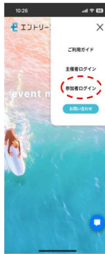
スマートフォンの場合

エントリープラスLINE公式アカウントで 「メニューを開く」から「LOGIN」をタップ