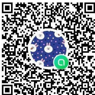
オープンチャット参加用 QR コード