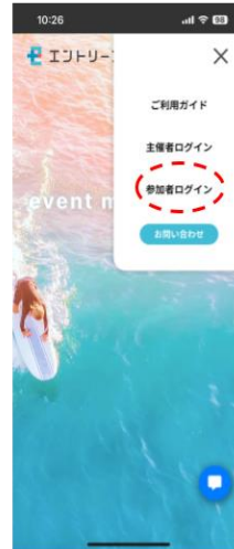
スマートフォンの場合

エントリープラスLINE公式アカウントで 「メニューを開く」から「LOGIN」をタップ